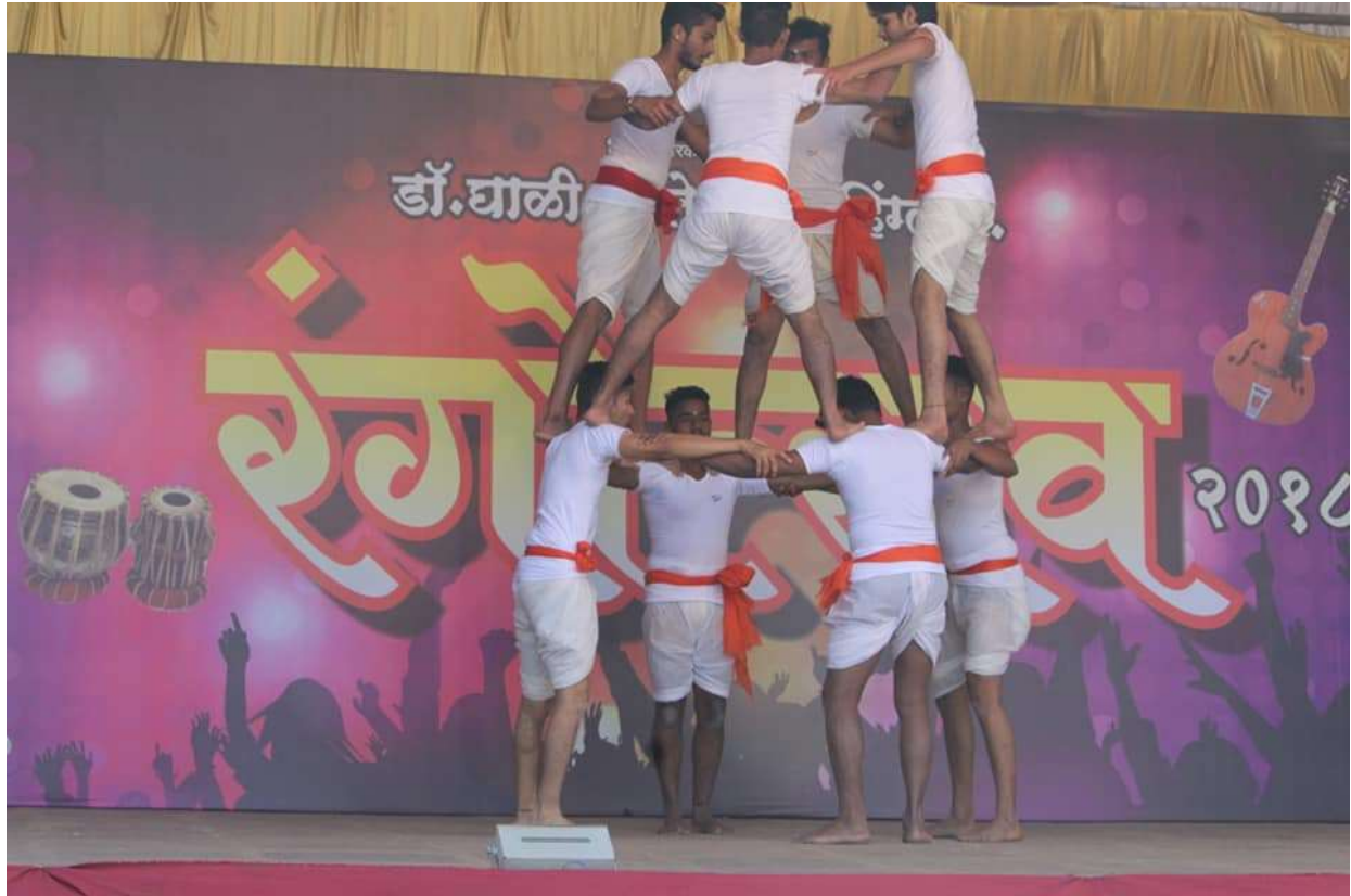
“Rangostav – 2K18” Cultural Program organized by our college (2018-19)