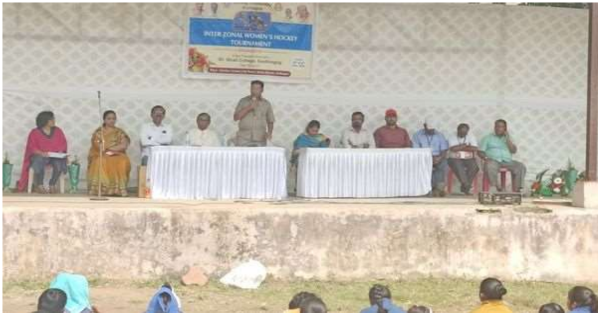
Inter-Zonal Women's Hockey Tournament organized by our college (2020-21)