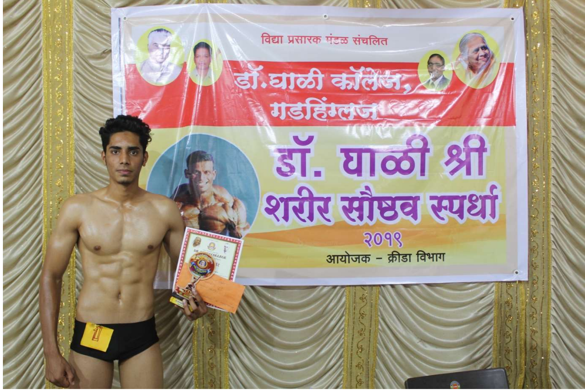
Body Building Competition organized by our college (2019-20)