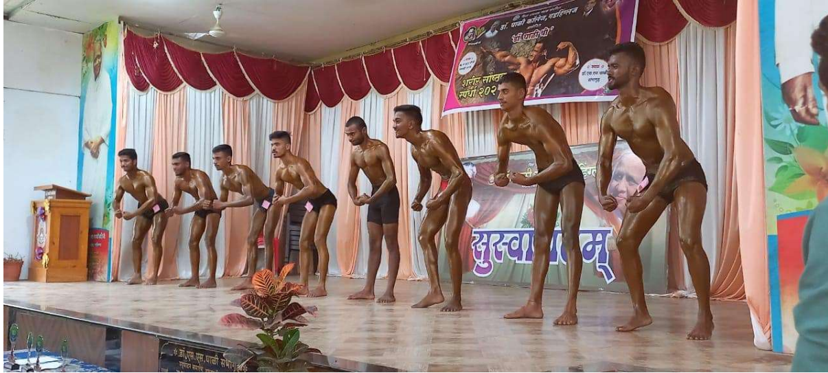
Body Building Competition organized by our college (2020-21)